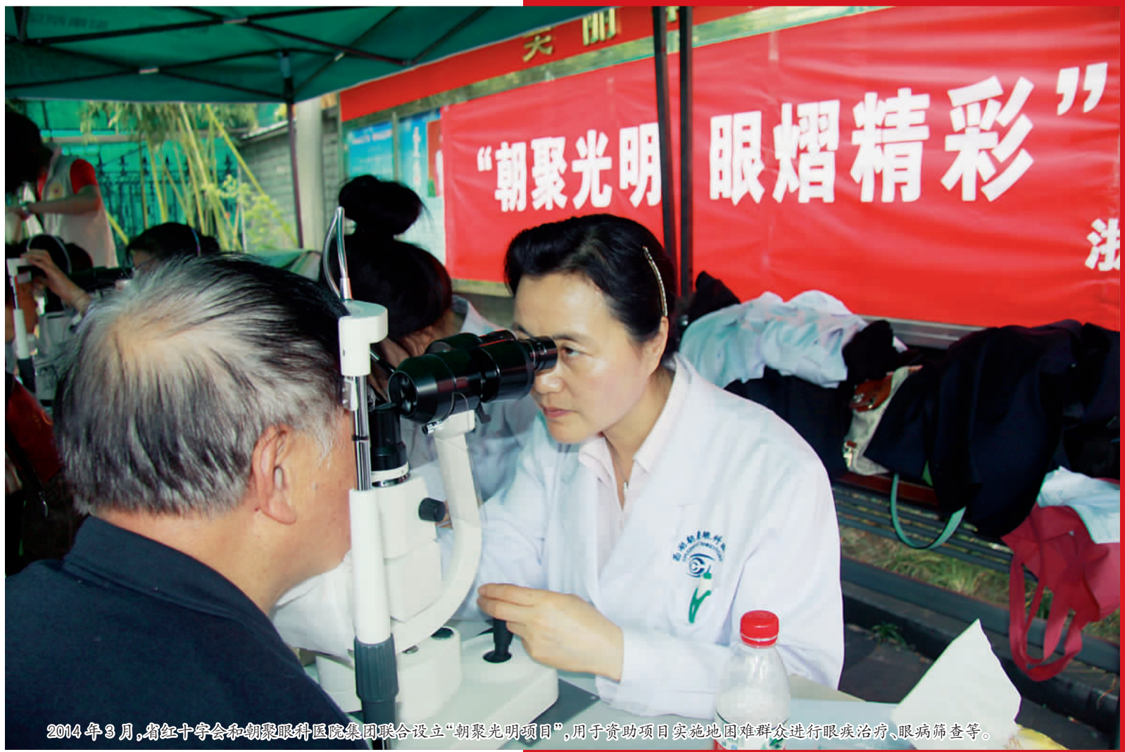
2014年9月,省红十字会和朝聚眼科医院集团联合设立“朝聚光明项目”,用于资助项目实施地困难群众进行眼疾治疗、眼病筛查等。