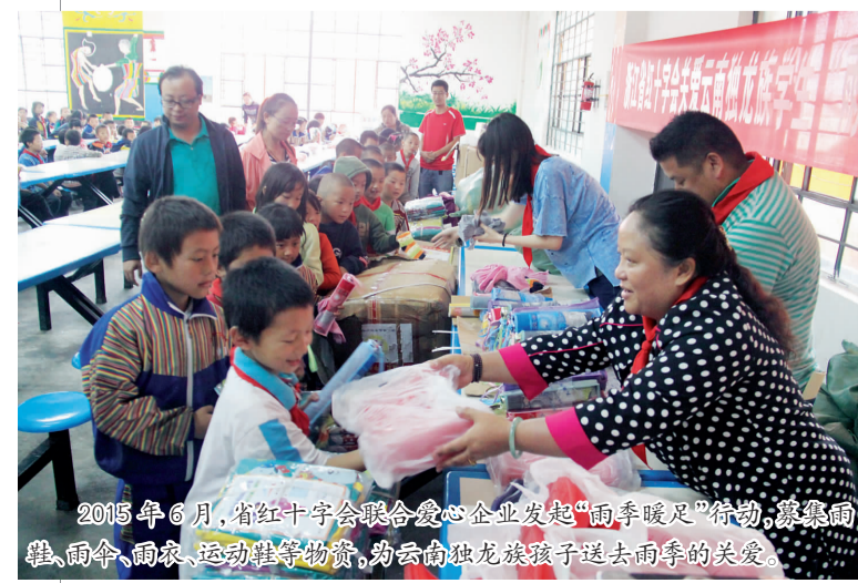
2015年6月,省红十字会联合爱心企业发起“雨季暖足”行动,募集雨鞋、雨伞、雨衣、运动鞋等物资,为云南独龙族孩子送去雨季的关爱。