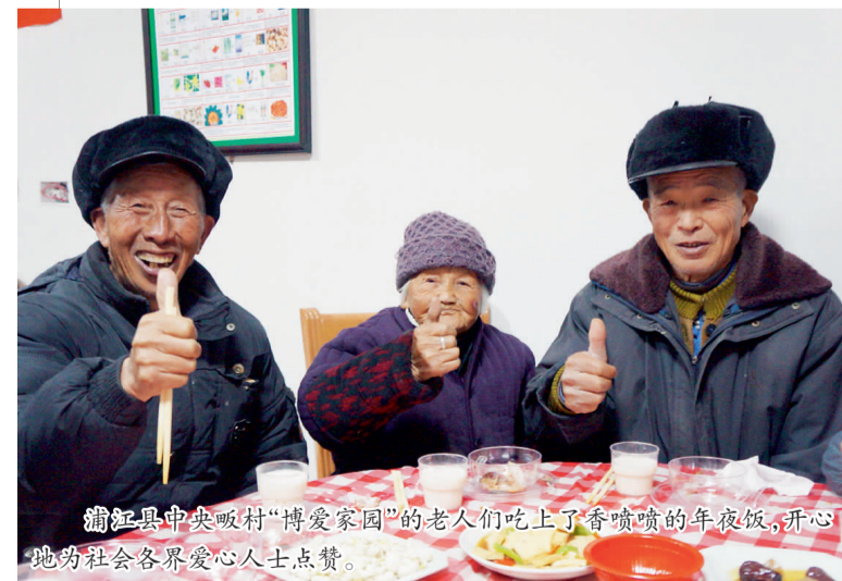
浦江县中央畈村“博爱家园”的老人们吃上了香喷喷的年夜饭,开心地为社会各界爱心人士点赞。