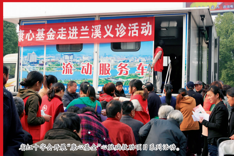
省红十字会开展“康心基金”心脏病救助项目系列活动。