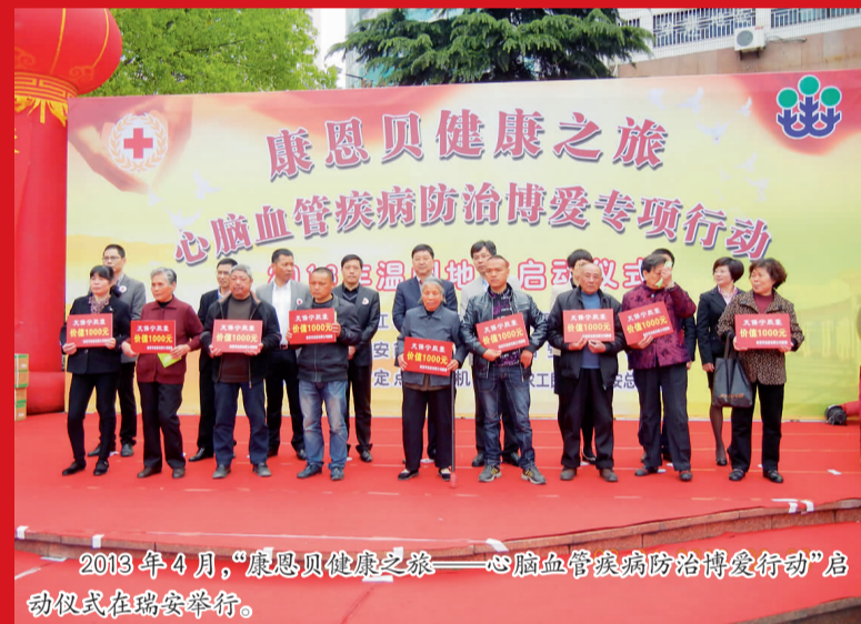
2013年4月,“康恩贝健康之旅——心脑血管疾病防治博爱专项行动”启动仪式在瑞安举行。

加强项目规范管理和信息公开。制定出台《浙江省红十字会项目管理指导手册》,加强项目规范管理,做到每个项目都制定管理办法、实施方案,开展督导检查,注重实施过程中的资料收集整理,加强痕迹管理,形成阶段性资料汇编,及时向捐赠方进行反馈。加大信息公开力度,借助官方网站、微博、微信等自媒体平台,及时公开捐赠款物接受与使用、人道救助项目实施进展的相关信息,做到公开、透明、规范。主动邀请审计部门或第三方审计机构,对捐赠款物使用情况进行审计,审计结果及时向社会公开。