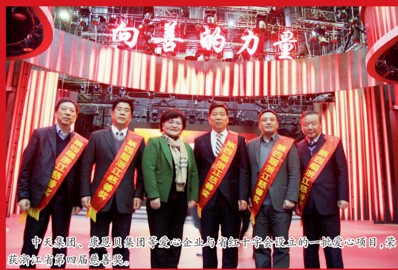
中天集团、康恩贝集团等爱心企业与省红十字会设立的一批爱心项目,荣获浙江省第四届慈善奖。