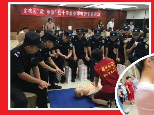
►杭州市余杭区红十字救护培训走进党群服务中心。