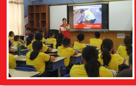
►衢州市红十字会联合柯城区红十字会、衢州市120急救中心等举办“世界急救日”系列宣传活动。