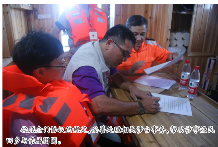
按照金门协议的规定,妥善处理相关涉台事务,帮助涉事渔民返乡与亲属团圆。