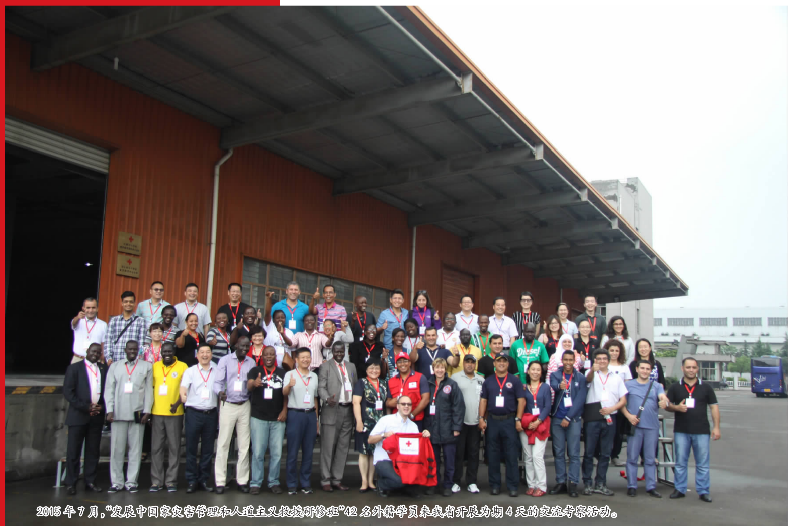
2015年7月,“发展中国家灾害管理和人道主义救援研修班”42名外籍学员来我省开展为期4天的交流考察活动。