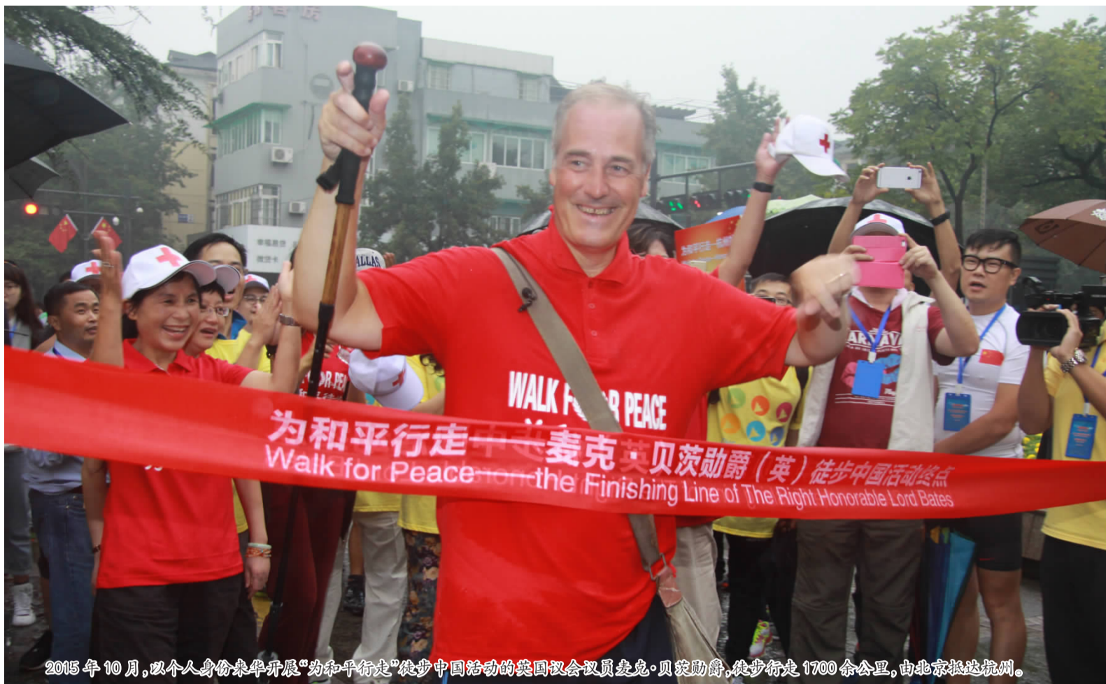
2015年10月,以个人身份来华开展“为和平行走”徒步中国活动的英国议会议员麦克·贝茨勋爵,徒步行走1700余公里,由北京抵达杭州。