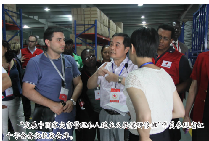
“发展中国家灾害管理和人道主义救援研修班”学员参观省红十字会各灾救仓库。