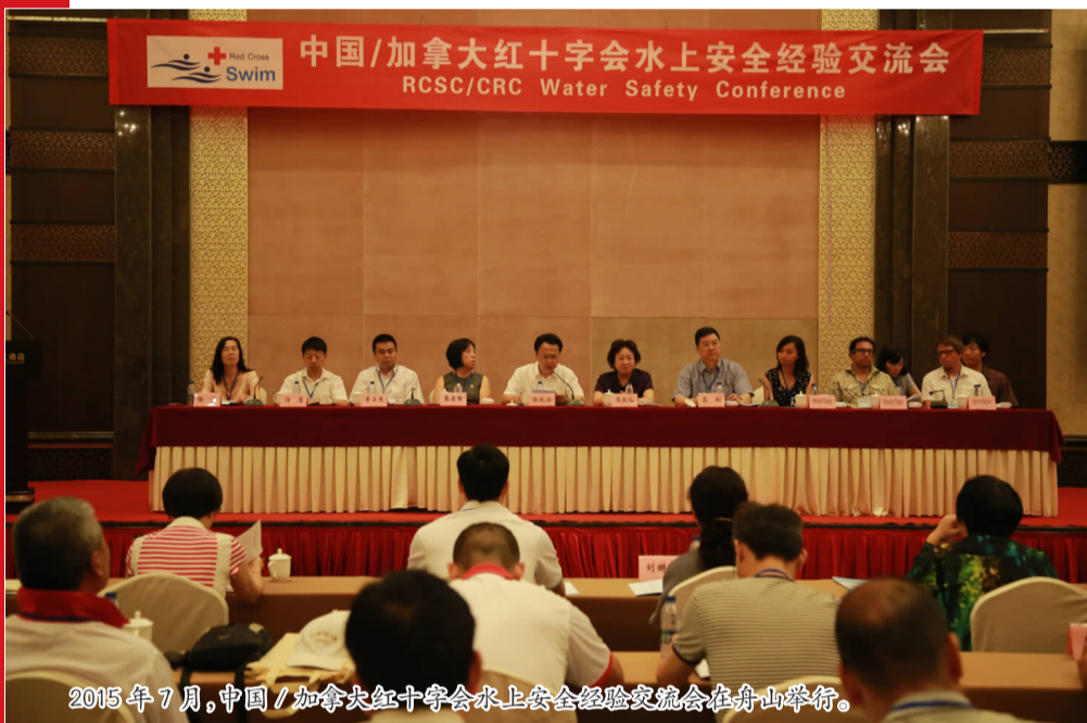
2015年7月,中国/加拿大红十字会水上安全经验交流会在舟山举行。

认真做好与四川、贵州、新疆、西藏、青海等省区和我省青田、景宁等山区县的对口帮扶工作,累计投入款物5500余万元。加强与兄弟省(区、市)红十字会的交流与合作,共同促进中国特色红十字事业发展。