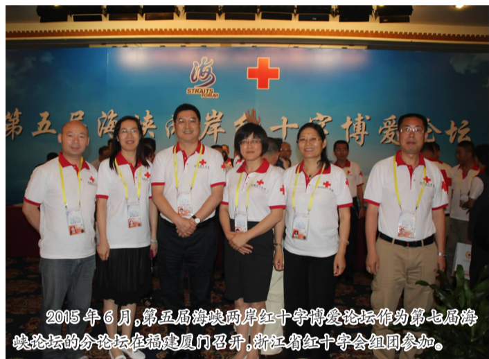
2015年6月,第五届海峡两岸红十字博爱论坛作为第七届海峡两岸论坛的分论坛在福建厦门召开,浙江省红十字会组团参加。