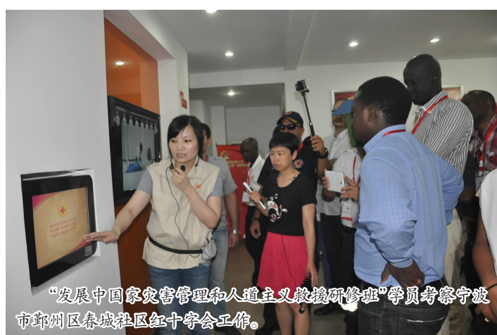
“发展中国家灾害管理和人道主义救援研修班”学员考察宁波市鄞州区春城社区红十字会工作。