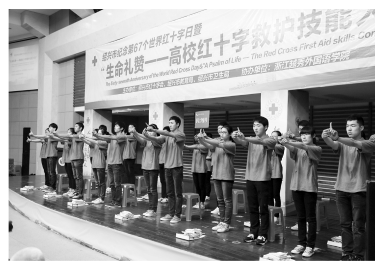
绍兴市举行“生命礼赞——高校红十字救护技能大赛”。