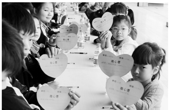
杭州市江干区红十字会举办认领微心愿活动,帮助小候鸟圆梦。