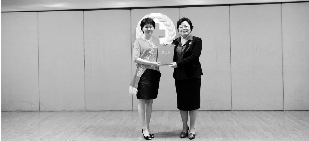
温州市红十字会聘请著名影视戏剧表演艺术家陶慧敏担任公益宣传形象大使。