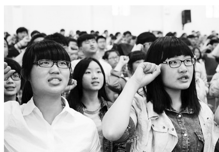
衢州高级中学举行红十字会成立大会,300多名学生宣誓入会。