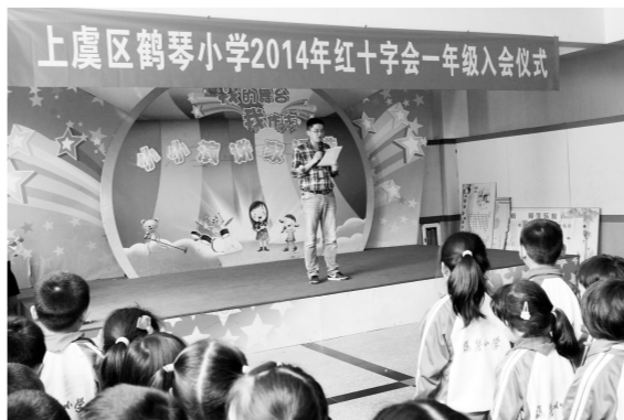
绍兴市上虞区鹤琴小学179位一年级学生加入学校红十字会。