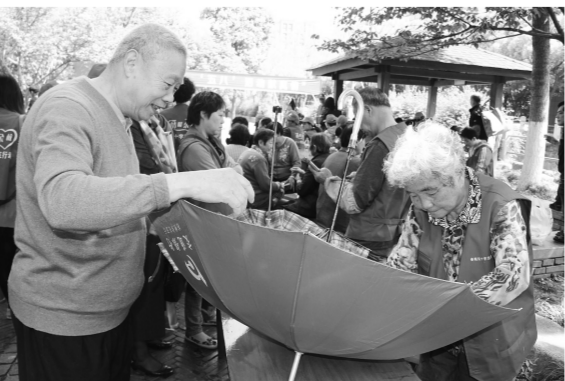
杭州市余杭区红十字会在临平东湖街道东社区举行博爱家园中心暨志愿者服务进社区活动。