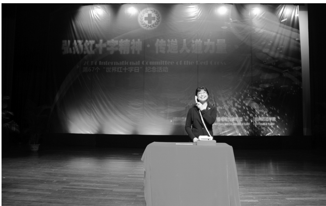
湖州现场开通“湖州红十字心理热线”电话和“湖州红十字心理健康在线”网站。