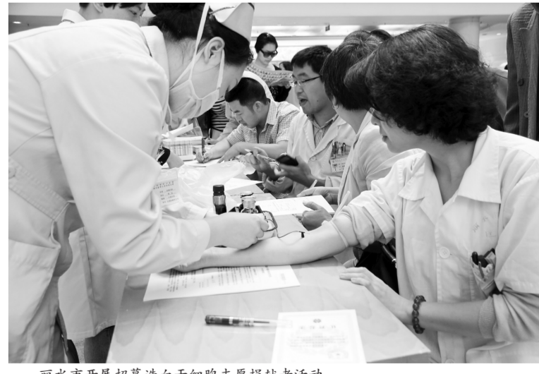
丽水市开展招募造血干细胞志愿捐献者活动。