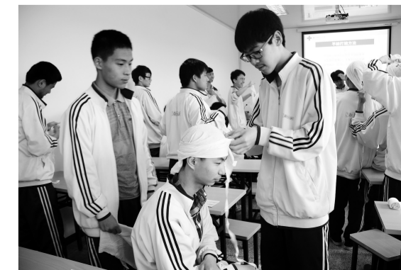
台州市椒江区红十字会开展急救培训进校园活动,为40多位三梅中学师生讲解示范创救护四项技术。