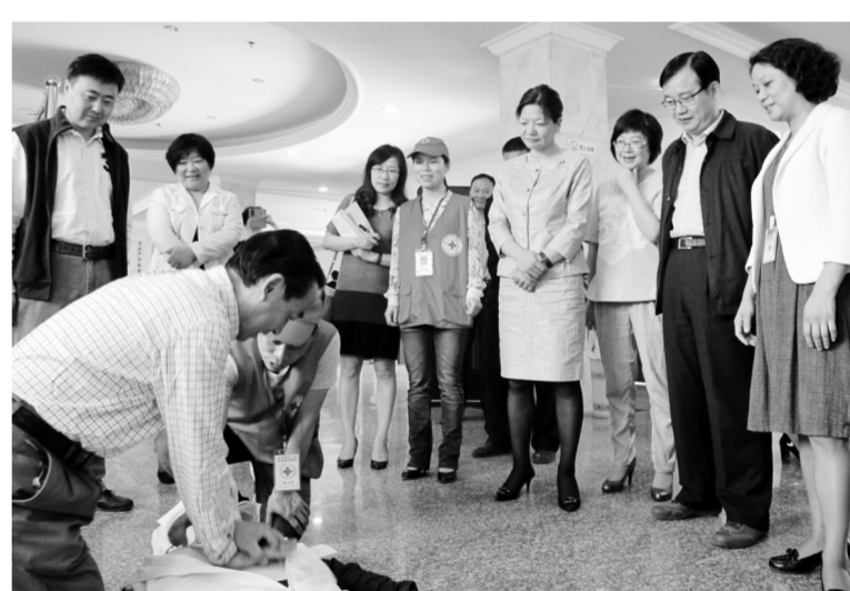
金华市红十字会举办开放日活动,市政协副主席傅玲红体验现场救护。