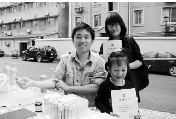
宁波市江北区红十字会联合卫生、教育等部门开展造血干细胞志愿者招募活动。