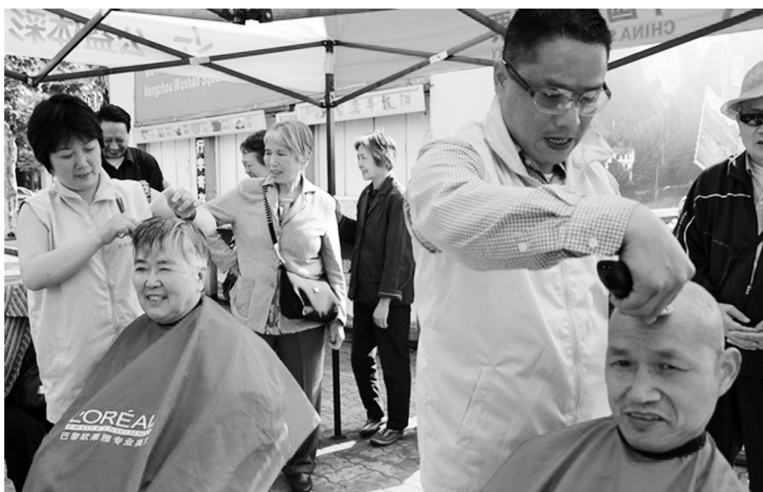
杭州市红十字志愿者免费为市民理发。