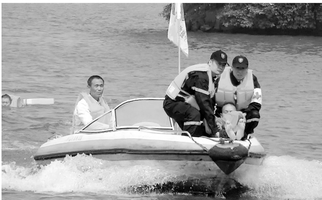
嘉兴市红十字水上应急救援志愿服务队在南湖景区开展救援演练。