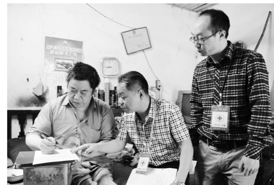
江山市红十字会工作人员为6位有器官捐献意愿但行动不便的残疾人提供上门服务,现场指导他们填写捐献自愿书。