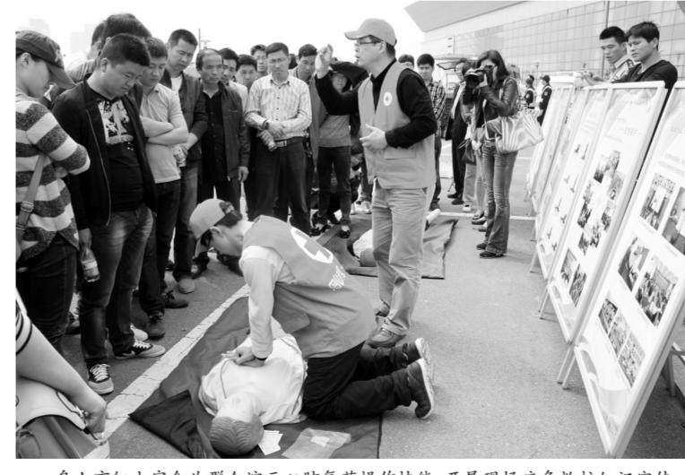
舟山市红十字会为群众演示心肺复苏操作技能,开展现场急救知识宣传。