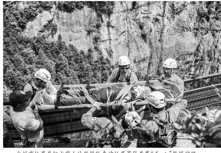
台州市仙居县红十字山地救援队在神仙居景区开展“五·八”救援演练。